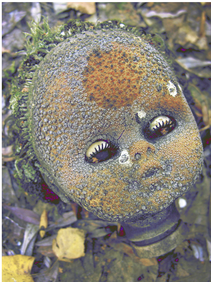
«La poupée atomique» abandonnée au Jardin d'enfants de Prypiat Tchernobyl - Ukraine - Photo: AGB – 2005